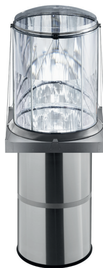
Solatube® M74 DS sestava s Collector Maximalizuje světelný výkon

Poskytuje soustředěné světlo do potřebné zrakové úrovně