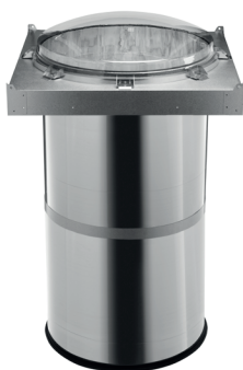
Solatube® M74 DS sestava základní

Poskytuje světlo rovnoměrně po celé ploše