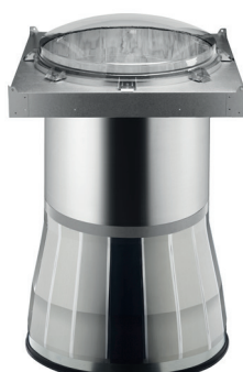
Solatube® M74 DS sestava s Amplifier

Poskytuje světlo rovnoměrně po celé ploše