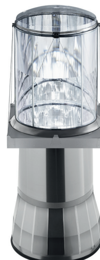
Solatube® M74 DS sestava s Amplifier a Collector Maximalizuje a soustřeďuje denní světlo